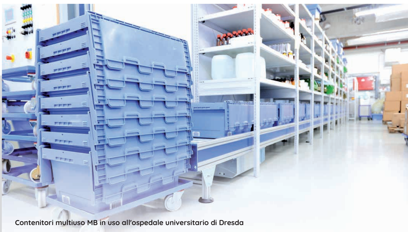
Contenitori multiuso MB in uso all'ospedale universitario di Dresda