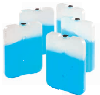
Piastre eutettiche rigide (PCM)