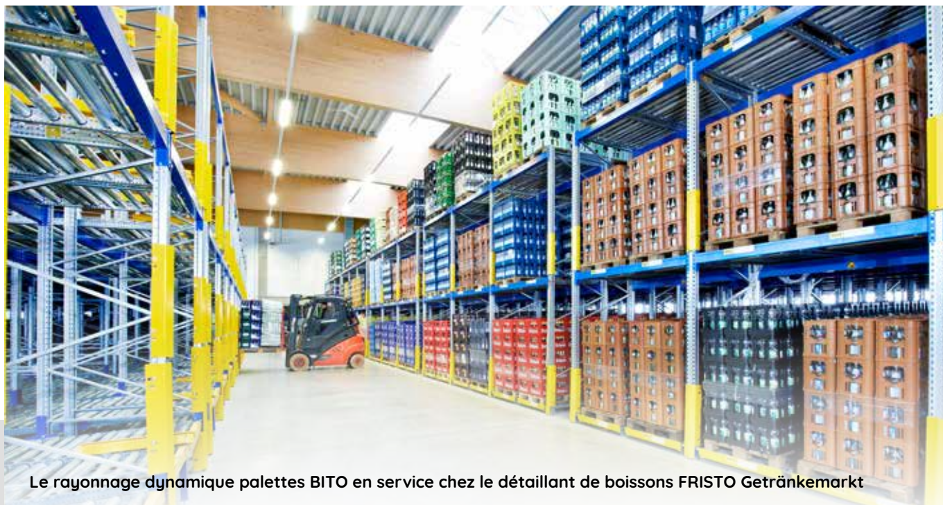
Le rayonnage dynamique palettes BITO en service chez le détaillant de boissons FRISTO Getränkemarkt

Le système de rayonnages dynamiques palettes n'exige pas d'allées de service dans le bloc de rayonnages, permettant ainsi d'économiser 60 % de la surface de stockage par rapport à un rayonnage pour palettes conventionnel.