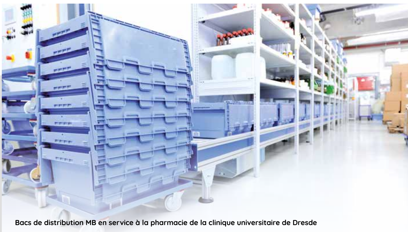
Bacs de distribution MB en service à la pharmacie de la clinique universitaire de Dresde