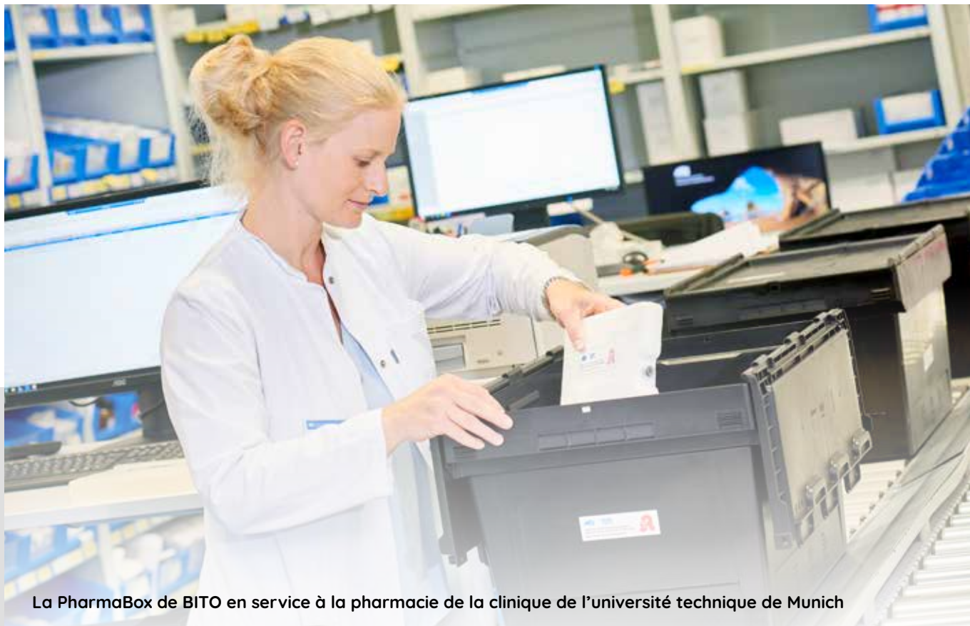
La PharmaBox de BITO en service à la pharmacie de la clinique de l'université technique de Munich

C'est pourquoi BITO a développé un bac de transport réutilisable à réfrigération passive pour les marchandises sensibles à la température, la BITO PharmaBox . La PharmaBOX permet d'expédier des vaccins, des échantillons de laboratoire et des médicaments dans une plage de température prédéfinie pendant une durée de transport de 37 à 80 heures.