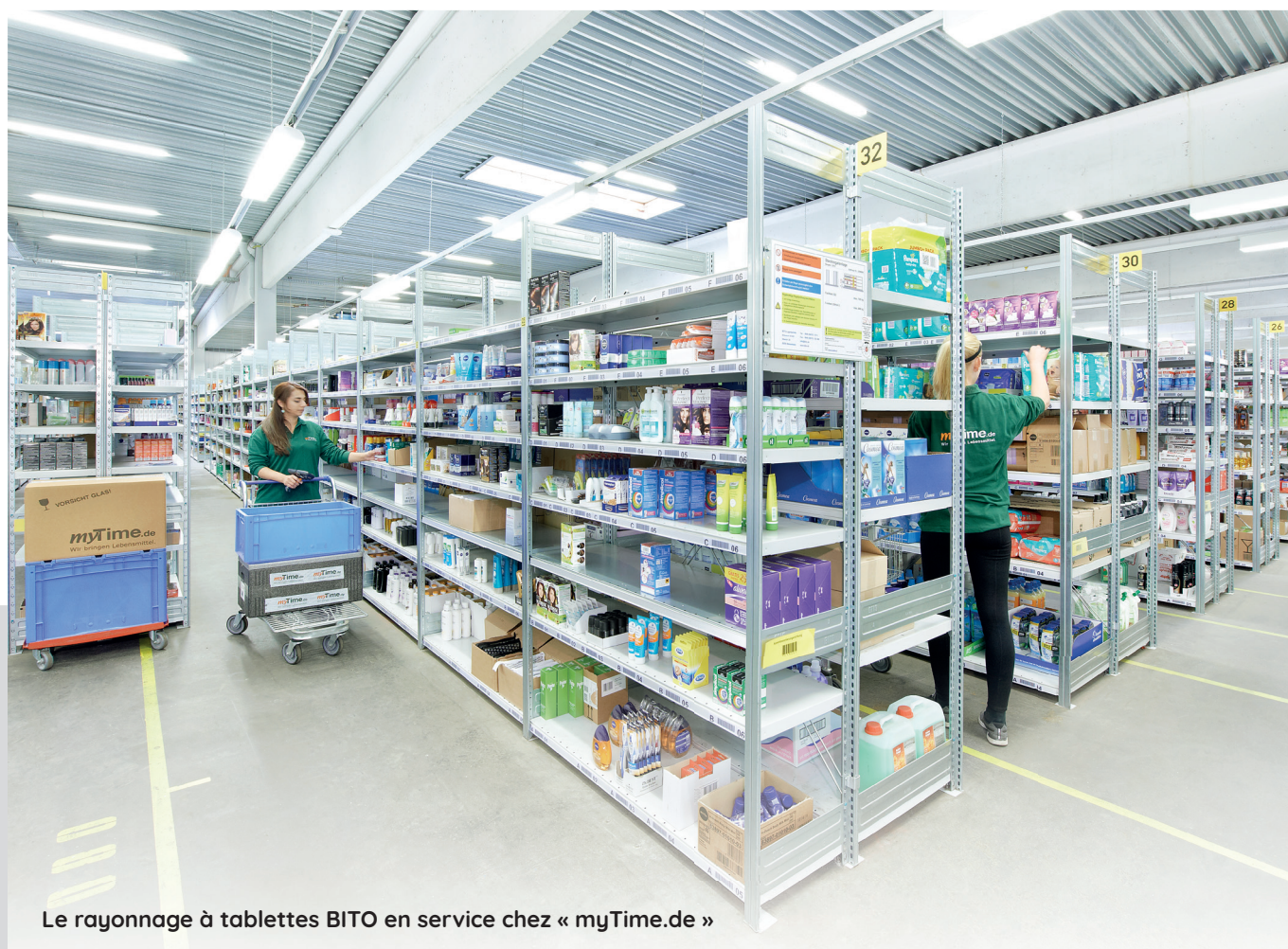
Le rayonnage à tablettes BITO en service chez « myTime.de »

Polyvalents, flexibles et de qualité supérieure, les rayonnages à tablettes BITO conviennent au stockage d'un grand nombre d'articles différents. Ils s'adaptent de manière optimale en hauteur et en longueur à chaque espace, sont faciles à monter et à adapter et ils peuvent être élargis ultérieurement selon besoin. Ils sont idéaux pour le stockage et la préparation de commandes de charges unitaires ainsi que d'articles en suremballage ou en vrac.