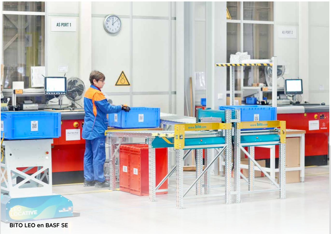
BITO LEO en BASF SE

Muchos clientes de una amplia gama de industrias ya están utilizando AGVs de la familia BITO LEO . BITO LEO se encarga de los transportes entre puestos de trabajo a lo largo de la cadena de suministro interna. En entornos de fabricación, LEO también actúa como almacén intermedio para productos de camino al siguiente paso de procesamiento o como línea de montaje no estacionaria. El sistema se completa con estaciones LEO para la carga y descarga automatizada de productos. Todas las variantes de LEO pueden adaptarse a las necesidades del cliente con una amplia selección de accesorios y opciones de servicio especiales.