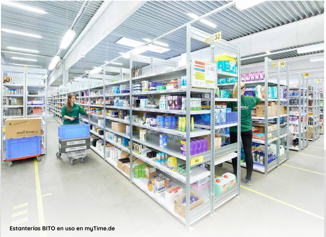
Estanterías BITO en uso en myTime.de

Las estanterías BITO cumplen estrictas normas de calidad. Se adaptan a cualquier tipo de producto. La altura y la longitud de las estanterías pueden ajustarse para adaptarse a cualquier espacio. El montaje y la configuración se realizan en pocos minutos y sin herramientas, y la ampliación posterior es igual de sencilla. Las estanterías BITO son adecuadas para productos no paletizados, ligeros o cargas unitarias que requieran un picking manual.