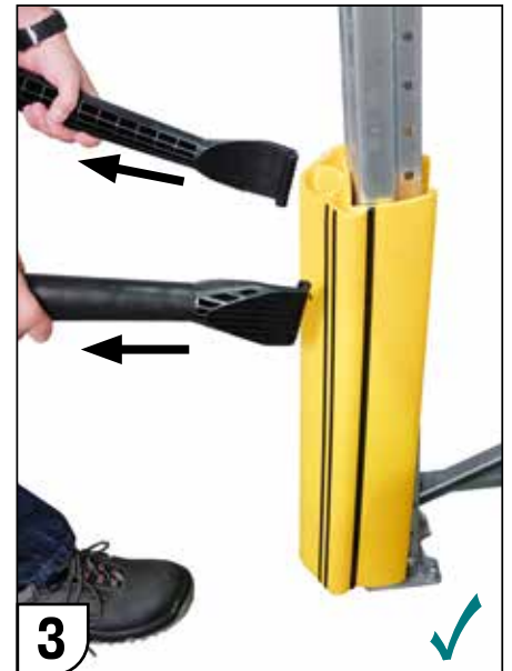
3 Aufbiegewerkzeug entfernen