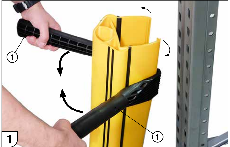
1 Mit dem Aufbiegewerkzeug in die Nut eingreifen und Regalschutz aufbiegen.