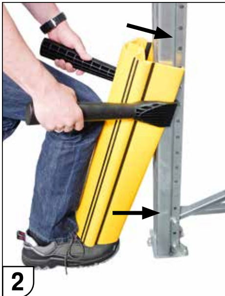
2 Regalschutz über die Regalstütze stülpen und an die gewünschte Position drücken.