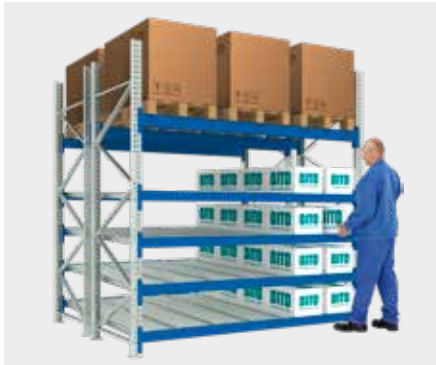
Rayonnage à palettes avec cadres traversants à rails à galets pour bacs et colis (stockage en FIFO)

Options d'équipement / d'utilisation pour le niveau au sol