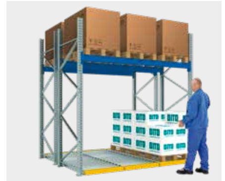
Rayonnage à palettes avec pistes à rouleaux pour palettes