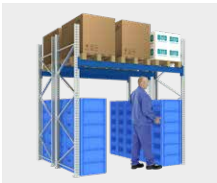
Rayonnage à palettes avec bacs en fonction « pick wall »