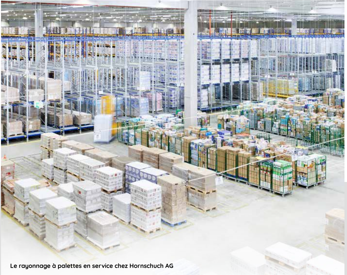
Le rayonnage à palettes en service chez Hornschuch AG

Le rayonnage à palettes reste le système de stockage le plus répandu pour les marchandises palettisées. Un investissement relativement limité et la flexibilité ont fait de ce système un élément essentiel de la logistique de stockage et de préparation des commandes. C'est pourquoi, malgré toutes les technologies modernes qui existent dans le domaine de la logistique, le rayonnage à palettes est toujours utilisé de préférence.