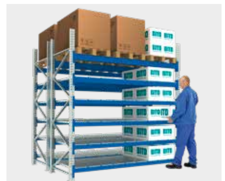
Rayonnage à palettes avec niveaux de platelage métalliques