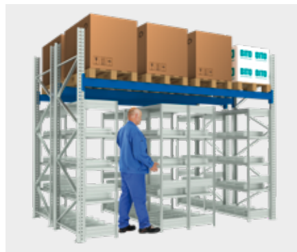
Rayonnage à palettes avec rayonnages à tablettes posés dans le sens de la longueur