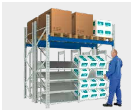
Rayonnage à palettes avec rayonnage à tablettes (niveaux inclinés)