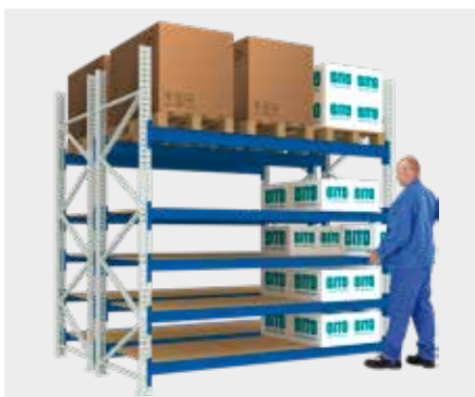
Rayonnage à palettes avec des niveaux en bois aggloméré