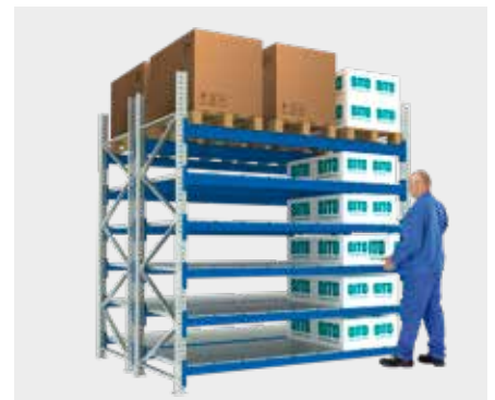
Rayonnage à palettes avec des niveaux en fil d'acier