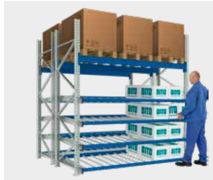
Rayonnage à palettes avec des rails à galets pour bacs ou colis (niveaux inclinés, stockage en LIFO)