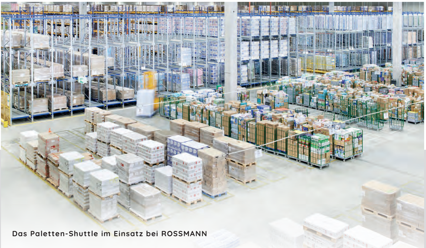
Das Paletten-Shuttle im Einsatz bei ROSSMANN

In dem Lagergang transportiert das Shuttle die Paletten selbstständig. Ein Gabelstapler wird verwendet, um das Shuttle zwischen den Gängen zu bewegen. Das System kann sowohl in FIFO- als auch in LIFO-Anwendungen eingesetzt werden. In einer Tiefkühlumgebung bis zu -30 °C kann das Shuttle eingesetzt werden.