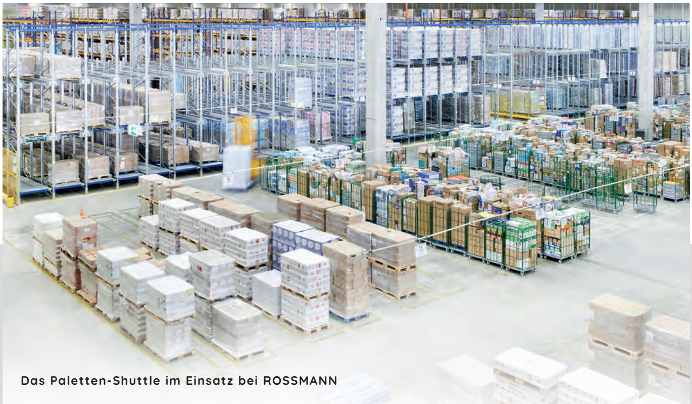
Das Paletten-Shuttle im Einsatz bei ROSSMANN

In dem Lagergang transportiert das Shuttle die Paletten selbstständig. Ein Gabelstapler wird verwendet, um das Shuttle zwischen den Gängen zu bewegen. Das System kann sowohl in FIFO- als auch in LIFO-Anwendungen eingesetzt werden. In einer Tiefkühlumgebung bis zu -30 °C kann das Shuttle eingesetzt werden.