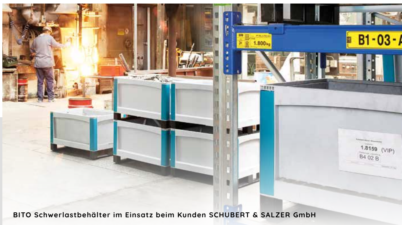
BITO Schwerlastbehälter im Einsatz beim Kunden SCHUBERT & SALZER GmbH

Neben der Nutzung für hohe Lasten können die Schwerlastbehälter SL auch überall dort eingesetzt werden, wo es auf ein sauberes und staubfreies Handling und den sicheren Transport von empfindlichen Teilen ankommt. Damit unterstützt der Behälter modernste Produktionsprinzipien und sorgt für saubere Produktionsbedingungen.