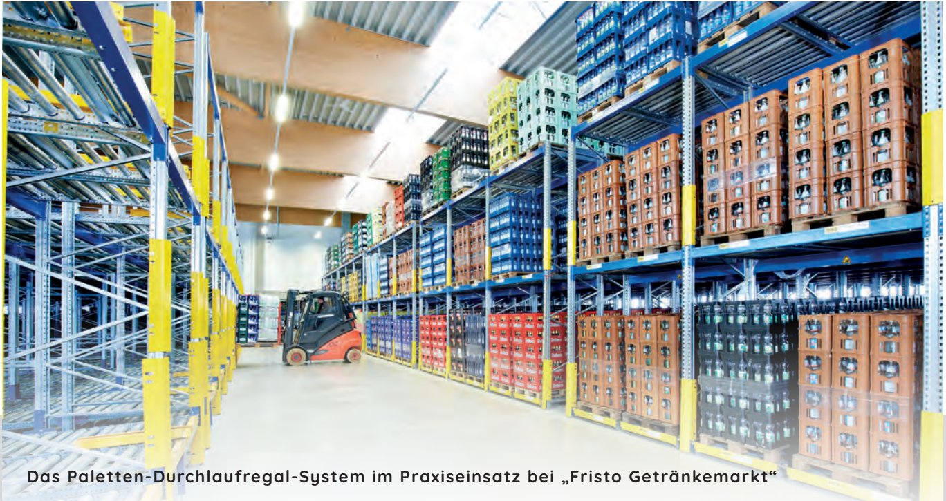
Das Paletten-Durchlaufregal-System im Praxiseinsatz bei „Fristo Getränkemarkt“

Im Paletten-Durchlaufregal-System werden keine Bediengänge innerhalb des Regalblocks benötigt, so dass im Vergleich zu einem Palettenregal 60 Prozent der Lagerfläche eingespart werden kann.