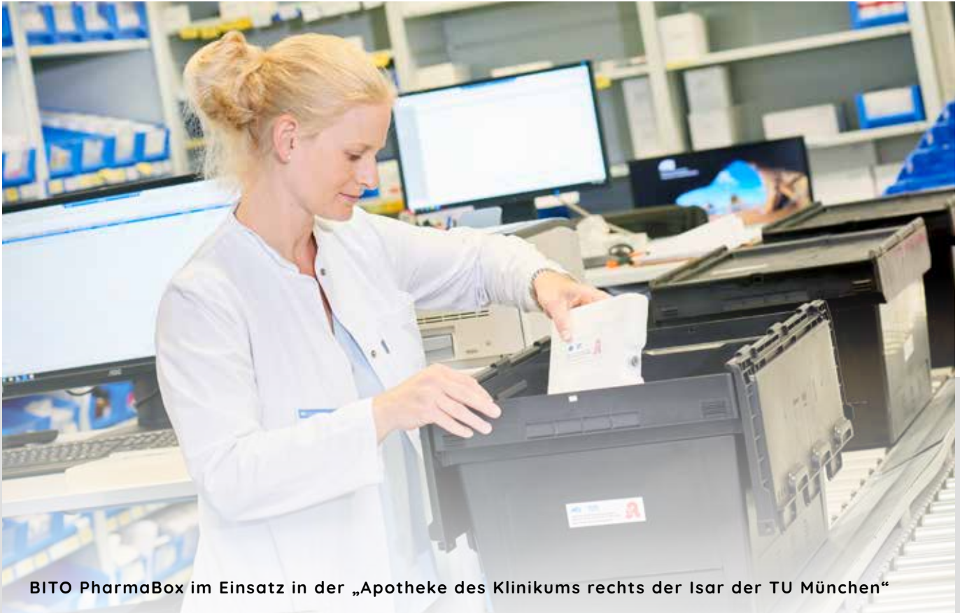
BITO PharmaBox im Einsatz in der „Apotheke des Klinikums rechts der Isar der TU München“

Wir haben einen passiv-gekühlten Mehrwegtransportbehälter entwickelt – die BITO PharmaBox . Dieses System ermöglicht es, den Versand temperaturempfindlicher Waren (u.a. Impfstoffe und Medikamente) über lange Laufzeiten (37 h bis 80 h) in den vorgegebenen Temperaturbereichen zu versenden.